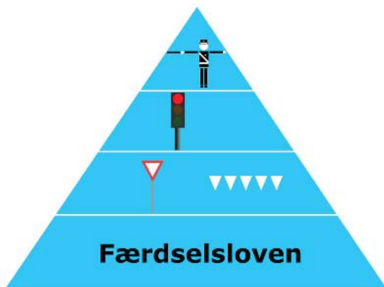
Vigepligts hiraki. Den øverste i pyramiden er vigtigst.

Husk: Du har ikke overholdt din vigepligt, hvis du har været til ulempe. Dvs. når du kommer ud på vejen, skal du op i fart uden at blive indhentet.